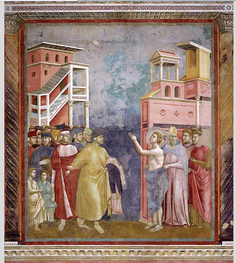
Franziskus gibt seinem Vater die Kleider zurück und verzichtet damit auf seinen Besitz (Fresko von Giotto di Bondone, um 1295)

26. bis 28. Sonntag, 29. September bis 13. Oktober