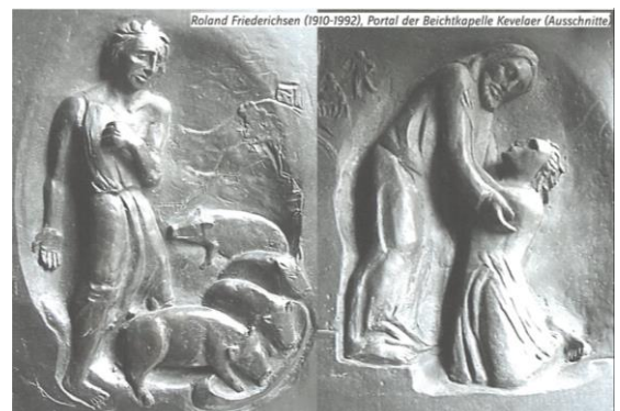
Tiefer Fall – Unerwarteter Halt